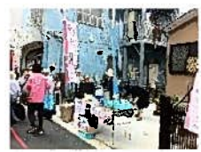
給茶スポットも設置しました