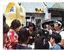
1年間で使うペットボトルは？

「ヨコハマ3R 夢」の情報発信イーオとのじゃんけん大会やマイ食器持参で「楽しく3R 夢クイズ」を行い、「ヨコハマ3R 夢」の啓発のきっかけとなりました。