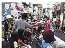
何が当たったかな？

商店で使える金券や食券、マイボトルにお花、声の送れる写真立て、衣類、お菓子、おもちゃなど次々プレゼント！