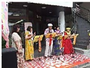
ウクレレのマウイ・ガールズ