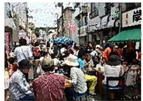
会場の根岸橋通り商店街