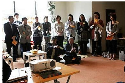
開所式で市へのプレゼンを再現しました

で快適であると同時に、親子が暮らす地域においても、安心して子育てができることが大切です。広場の利用者が、地域に顔の見える関係ができるように、利用者と地域の人をつなげ、地域の人が広場に関わる機会もつくっていきます。