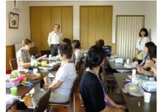
新築の滝頭岩瀬自治会館に集合！

同じ地域に暮らしていても、新しい人と話すチャンスは少ないのでは…。今回、身近なテーマで地元開催の講座を実施し、参加者同士が親しくなる機会となりました。保育があることで、子育てママも参加でき、新しい出会いが生まれました。当日の雰囲気をお伝えします。