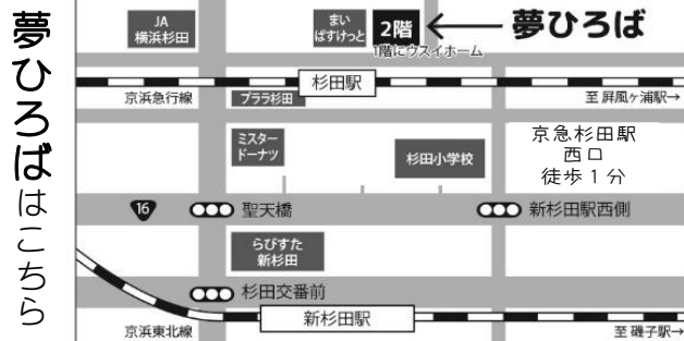
夢ひろば、ベビーカー置場とも2階です。お手伝いが必要な方は、お声かけください。